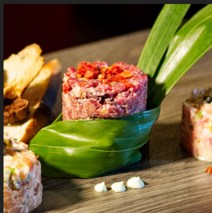
Puck de tartares 6 oz