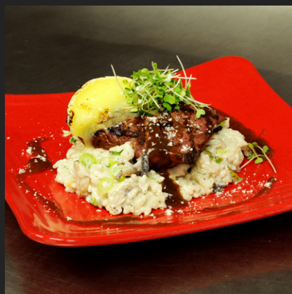
Macreuse de bœuf