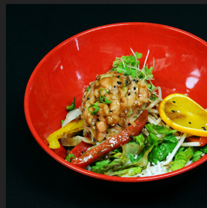
Poké bol au saumon